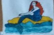
Легенда «Слезы русалки»