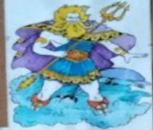
Легенды о Посейдоне