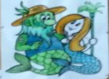
Легенды о Водяном.