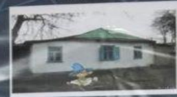
Дом семьи Носовых в посёлке Ирпень

Детство Носова прошло в посёлке Ирпень, недалеко от Киева.