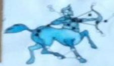
Легенда о созвездиях