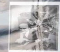
Николай Носов в гостях у ребят

Произведения Носова всегда добрые и весёлые, автор с лёгкостью и чутко относится к душевному строю маленького человека.