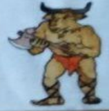
Миф «Лабиринт Минотавра»