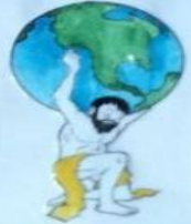
Миф о божестве Атлант.

9 представлений о земле древними народами.